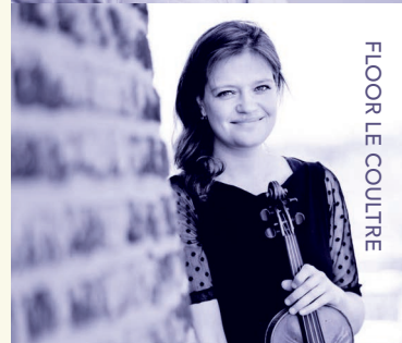
FLOOR LE COULTRE